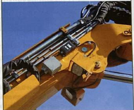
Op de giek en lepelsteel zijn drie hoeksensoren gemonteerd om de positie van de maaikorf te berekenen ten opzichte van de GPS-ontvangers.