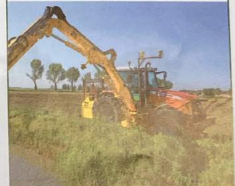
Op het draaipunt van de giek is een mast gemonteerd met twee GPS-ontvangers. Bij het zwenken naar voren, bijvoorbeeld voor transport, draaien de ontvangers over de cabine heen.