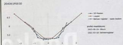
Het 3D-maaibeeld van juni 2023 en de leggerkaart van het waterschap van oktober 2021 komen aardig overeen.